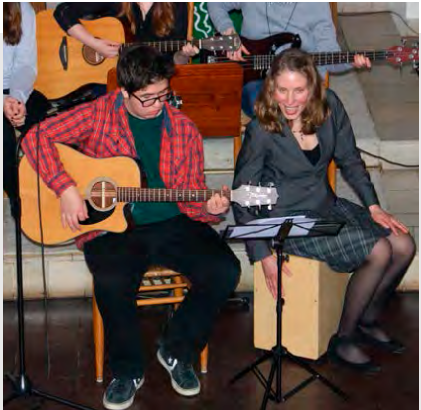
Süddorfer Jugendband RESET