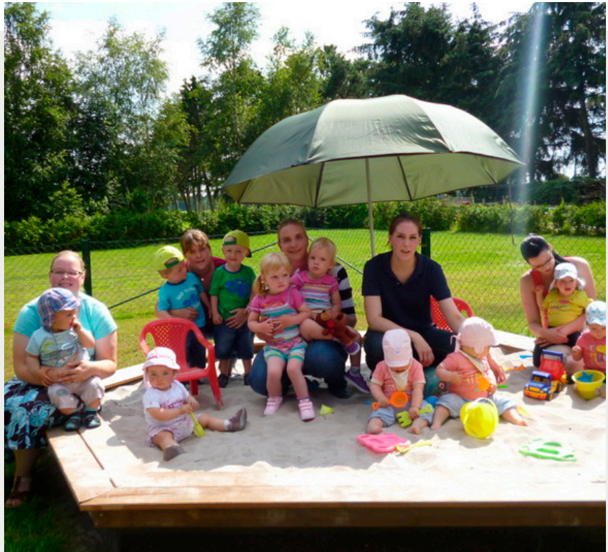
Teilnehmerinnen am Weltgebetstag