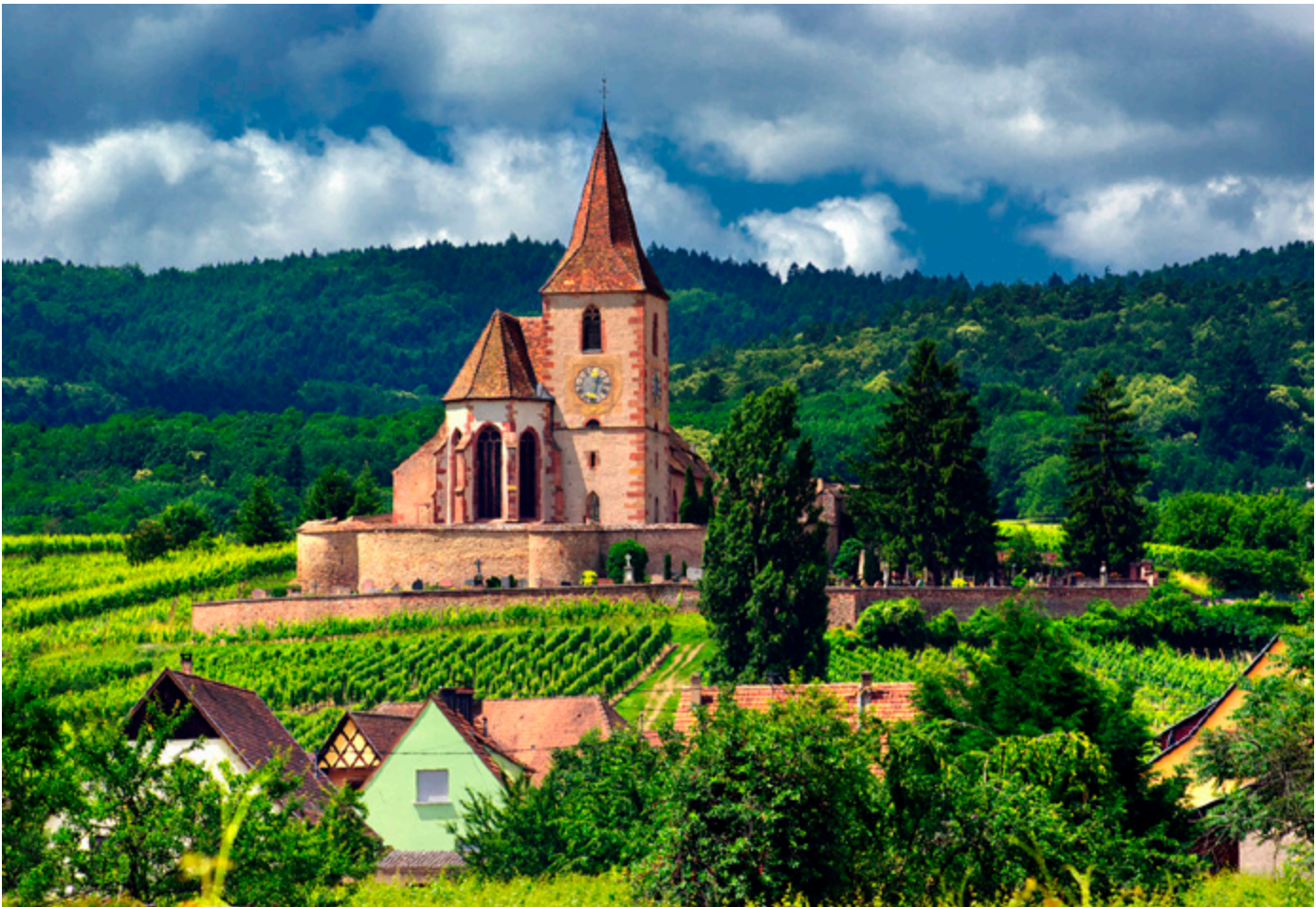
Eine Kirche in Südfrankreich

Die Kinder feiern jeden Sonntag Gottesdienst in den oberen Gemeinderäumen. Zum Segen kommen sie zurück zu den Erwachsenen und präsentieren stolz ihre kleinen selbstgebastelten Kunstwerke.