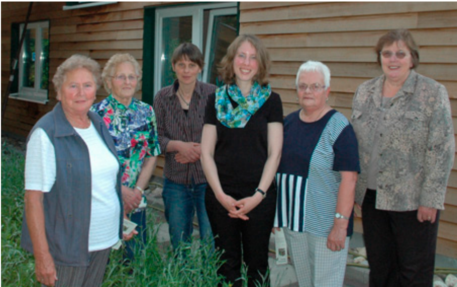
Der Süddorfer Besuchsdienst

Auf der Schnittstelle von Seelsorge und Gemeindediakonie sind die Besuchsdienste angesiedelt. Sie verfolgen das Ziel, dass alle älteren Gemeindeglieder mindestens einmal im Jahr von ihrer Kirche besucht werden. Dort, wo unsere PastorInnen aufgrund der übergroßen Gemeindegliederzahlen nicht alle persönlich erreichen können, steht eine Gruppe Ehrenamtlicher für die anfallenden Besuchsdienste bereit.