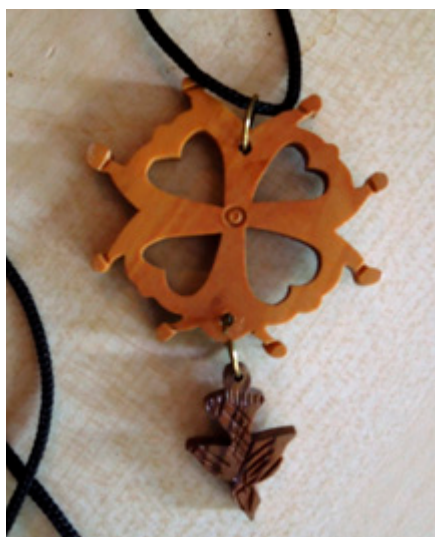
Das Hugenottenkreuz ist das Symbol der französischen Protestanten

eine ehemalige Synagoge, die die jüdische Kultusgemeinde der Kirchengemeinde nach dem 2. Weltkrieg überließ, da die Protestanten Juden in ihre Häuser aufgenommen und ihnen so das Leben gerettet hatten. Nicht selten muss eine Kirchengemeinde in Frankreich ihren Gottesdienstraum anmieten. Ein Kirchengebäude zu unterhalten ist teuer. Dies zwingt zum Verkauf und die Kirchengemeinde wird zur Mieterin ihrer „eigenen“ Räume.