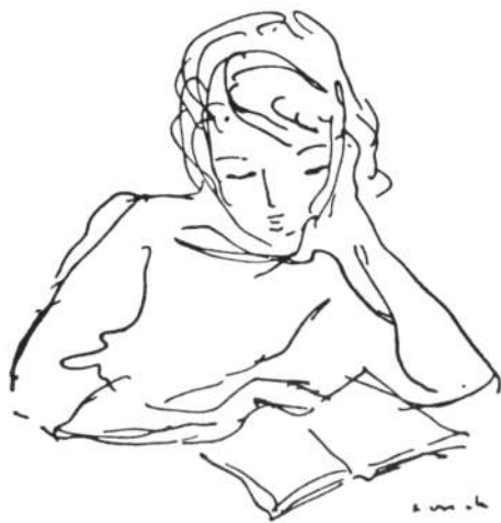
LESENDES MÄDCHEN Zeichnung H. Loreck